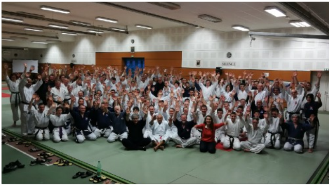
Photo de groupe et séance dédicace